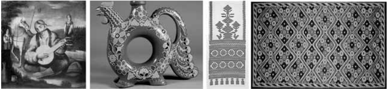
А Зала «Фольклорна»

16. Уявіть, що в сучасному готелі відкрито зали – галереї для відпочинку. Наведіть музичні аналогії з візуальними образами і доберіть музику, звучання якої було б доцільним в інтер'єрі кожної зали.